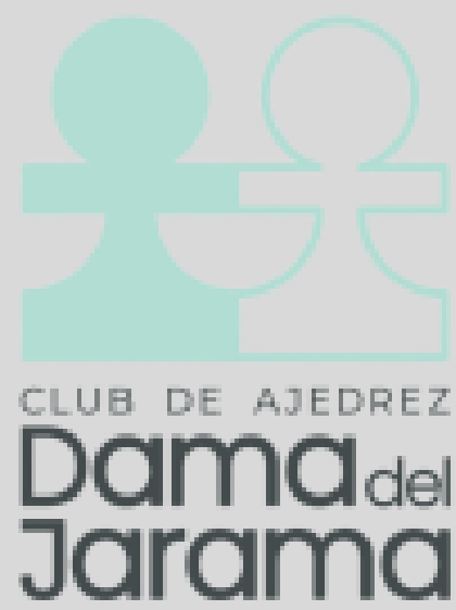
DAMA DEL JARAMA