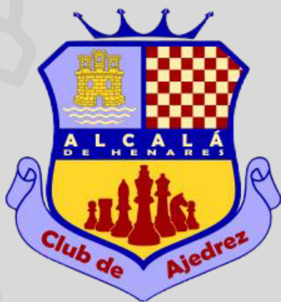
ALCALÁ DE HENARES