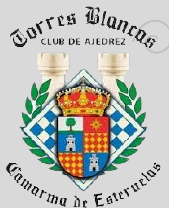
CAMARMA DE ESTERUELAS